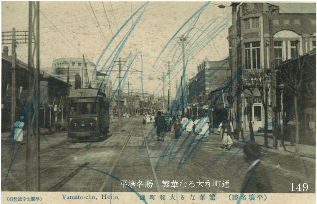
平壤名勝 繁華なる大和町通