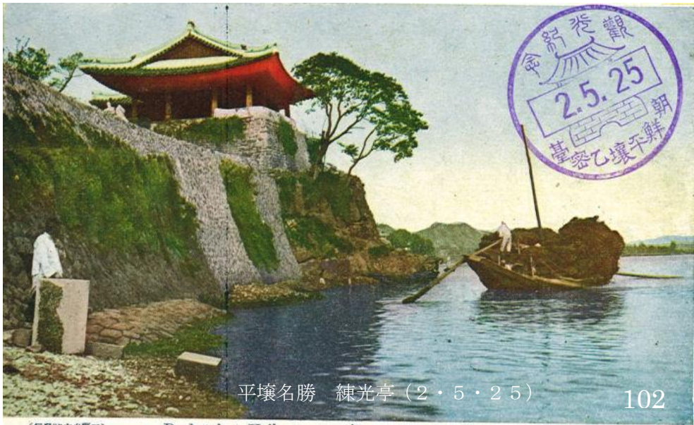
平壤名勝 練光亭 (2·5·25)