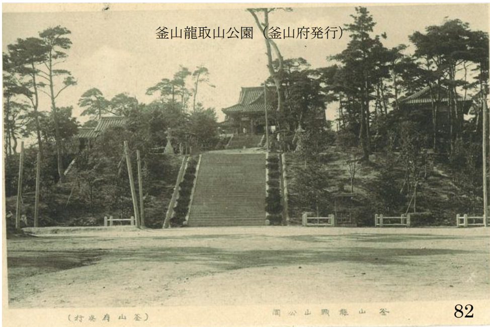
釜山龍取山公園 (釜山府發行)