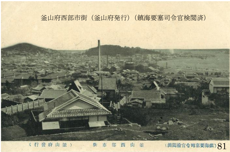
釜山府西部市街 (釜山府發行) (鎮海要塞司令官檢閱濟)