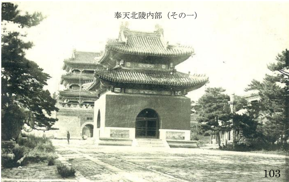
奉天北陵内部 (その一)