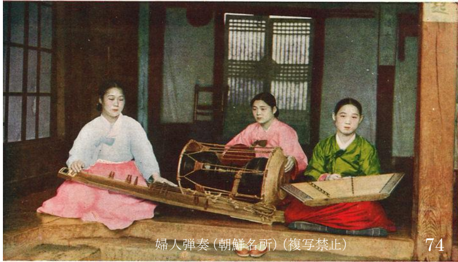
婦人弹奏(朝鮮名所)(複写禁止)