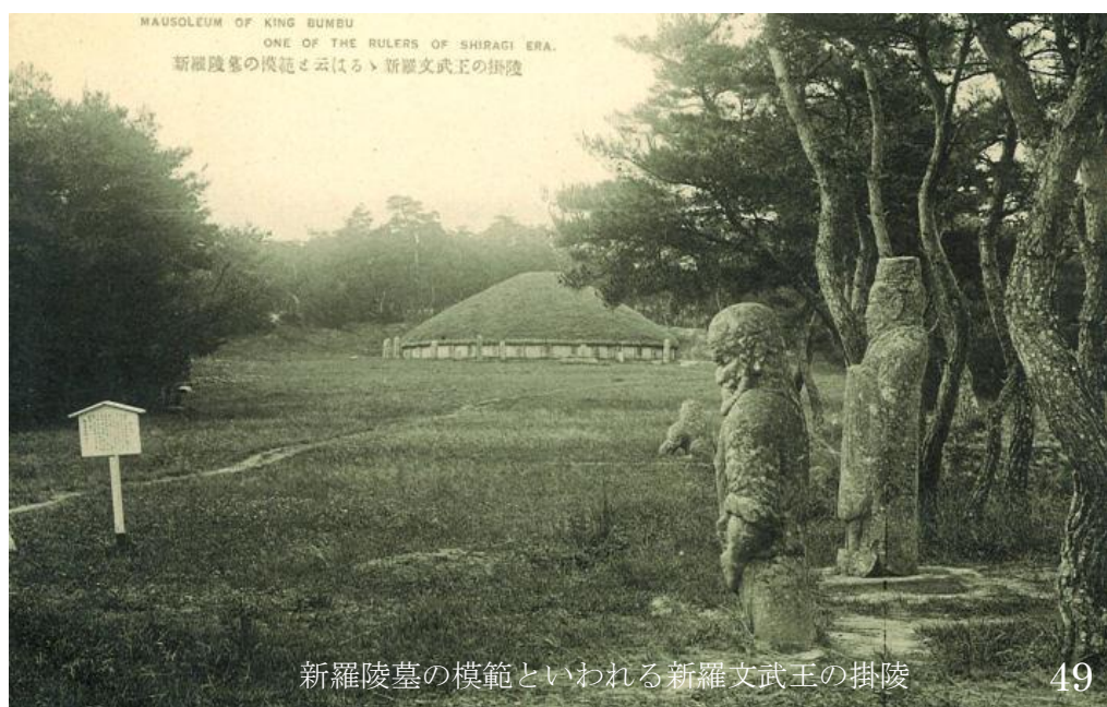
新羅陵墓の模範といわれる新羅文武王の掛陵